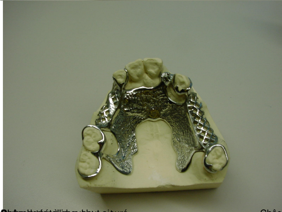
Châssis métallique bas en métal