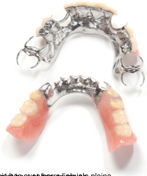
Châssis avec barre linguale pleine