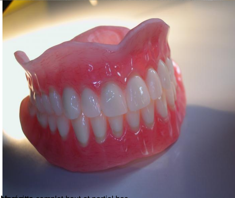
Maquette complet haut et partiel bas